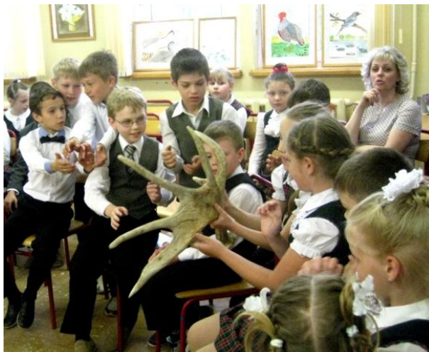
Лосиные рога оказались очень тяжелыми.