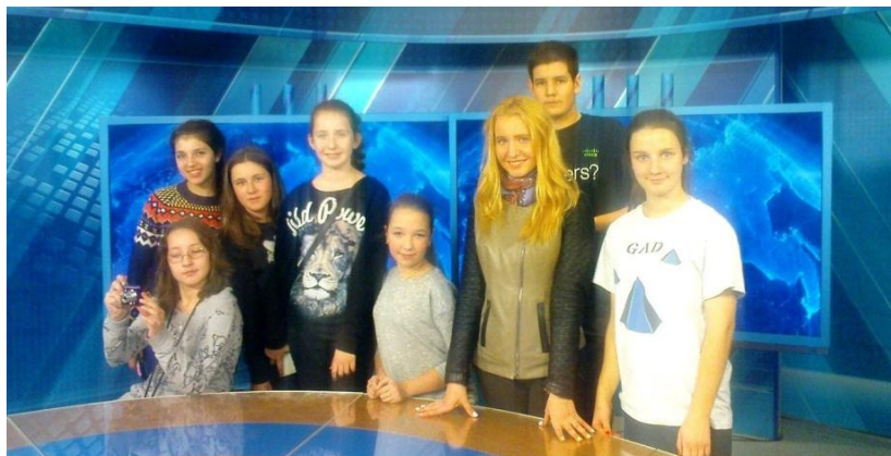
Участники Пресс-центра «СОТЫ» на телевизионной студии ГТРК «Ярославия».

ВСЕХ, кто мечтает стать корреспондентом, редактором, оператором, режиссёром, монтажером, ведущим или стилистом приглашаем в ШКОЛЬНЫЙ ПРЕСС-ЦЕНТР «СОТЫ»