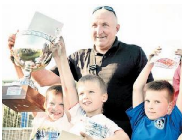
Кубок первоклассникам вручил главный тренер ФК «Шинник».