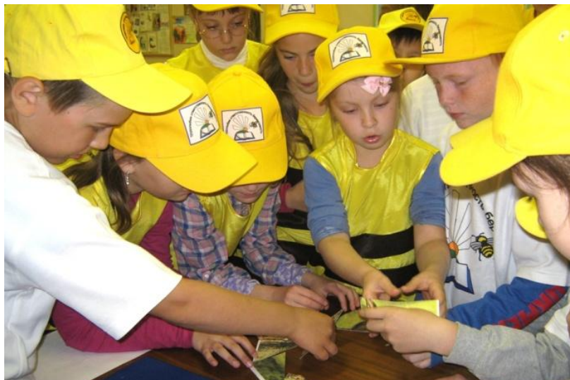
«Ярославские пчелки» проявили свою эрудицию.