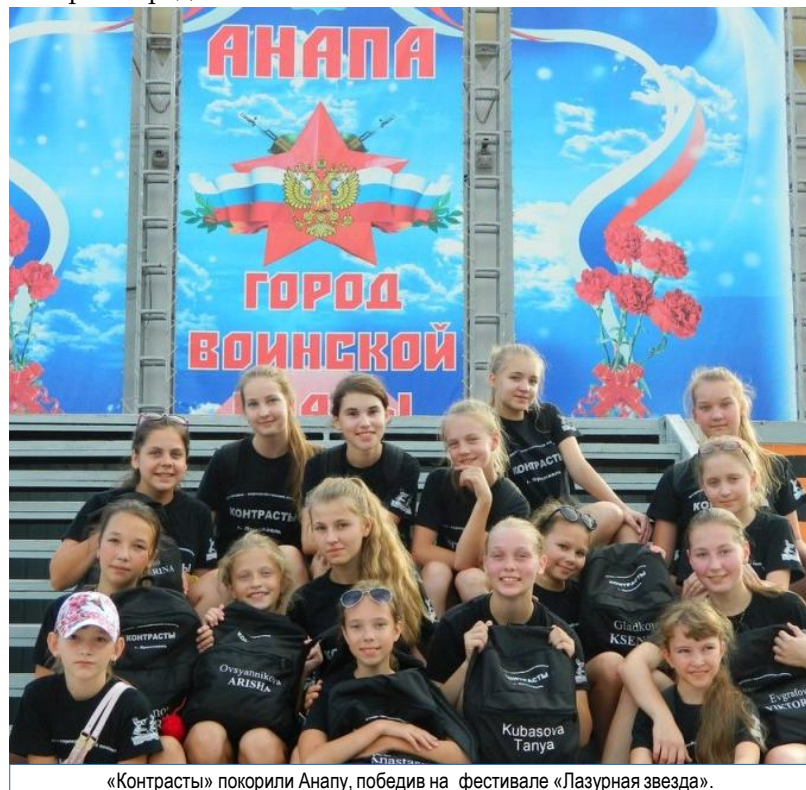
«Контрасты» покорили Анапу, победив на фестивале «Лазурная звезда».

В «Молодой гвардии» девочки не только отдыхали, они репетировали и выступали.