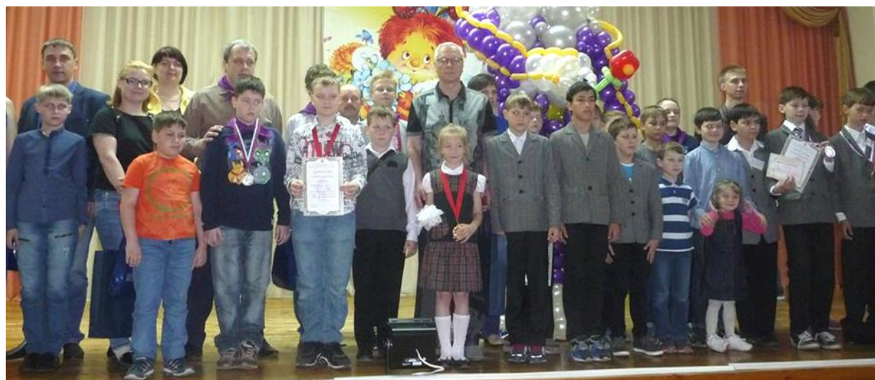
Участники и организаторы Семейного фестиваля робототехники «РОБОТиКоН».

Первый фестиваль стал настоящим праздником для всех участников и, конечно, все они с нетерпением ждут новой встречи на «РОБОТиКоНе».