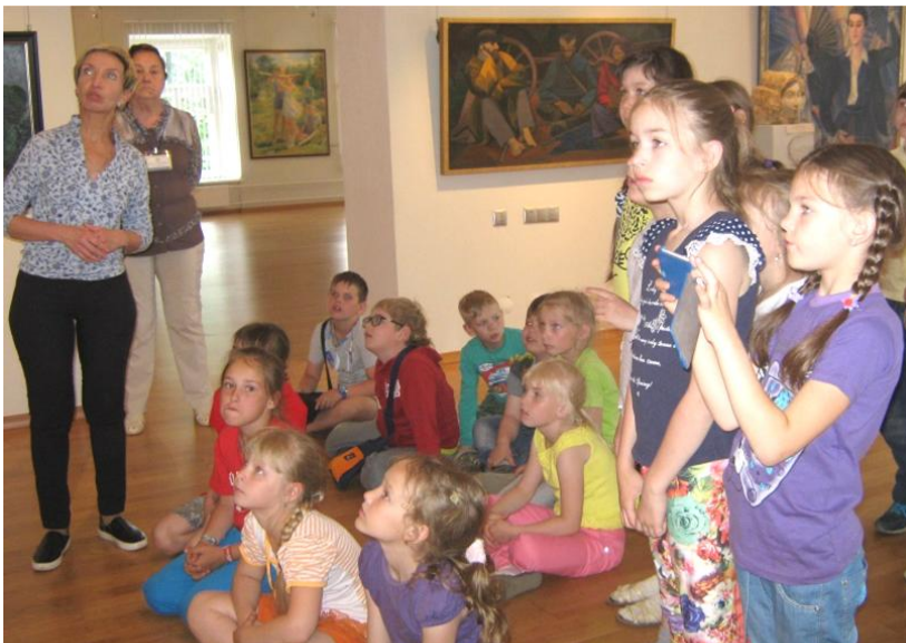
На экскурсии в Художественном музее.

А еще ребята из школьного лагеря приняли участие в подготовке специального выпуска газеты «СОТЫ», посвященного выпускникам 2016 года. Девчонки и мальчишки попробовали предсказать будущее одиннадцатиклассников по фотографии. Это было сделать очень нелегко, но юные эксперты-психологи справились с трудной задачей. Отметим, что необычный подарок – газета – очень понравился выпускникам.