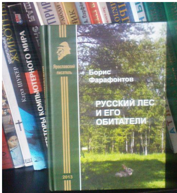
Книга «Русский лес и его обитатели» теперь в нашей библиотеке.

2016 год объявлен Годом экологии в России. Этому событию посвящено множество самых различных проектов и мероприятий. В нашей школе 25 мая состоялось внеклассное мероприятие, посвященное Международному дню леса. Проект готовился совместно с департаментом образования мэрии Ярославля.