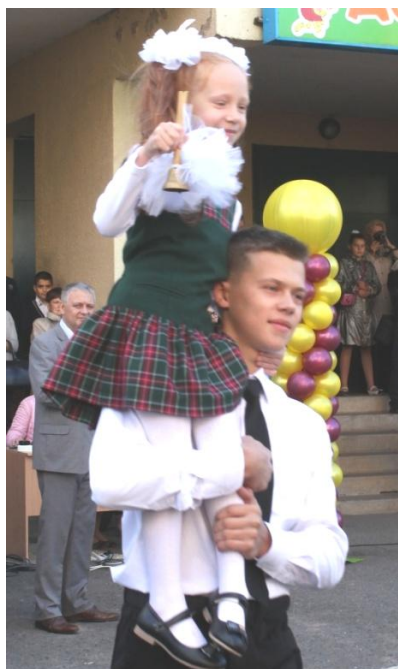
Первый звонок учебного года.

И вновь наша школа открыла свои двери для учеников. И вновь коридоры оживились беспечной бегомней детей, с учебников сдули поднакопившуюся пыль, а под партами появились свежие жвачки. Вновь мы отметили День знаний.