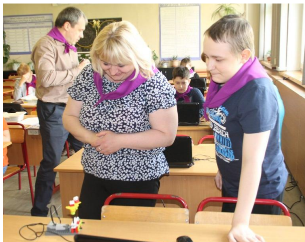
Радостно, когда собранный конструктор работает.

В конце мая в средней школе № 90 г. Ярославля состоялся Первый семейный фестиваль робототехники «РОБОТиКоН» (РОБОТ и команда НОВАТОРОВ).