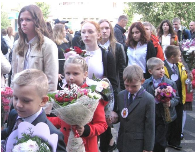
Старшеклассники провожают первоклашек в новый школьный мир знаний.