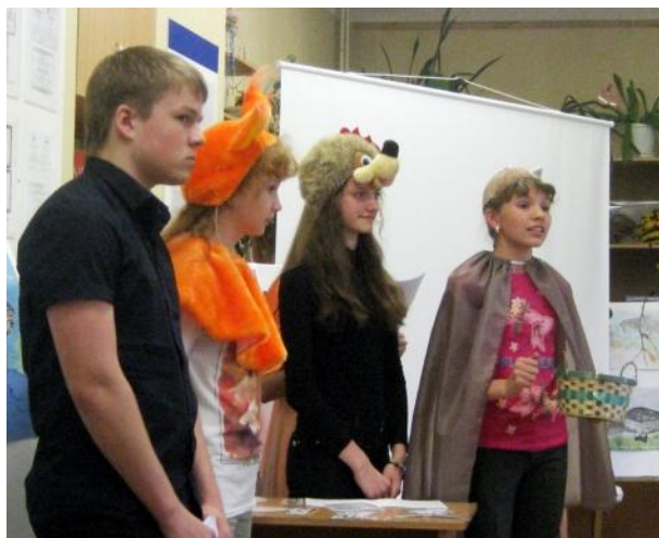
Артисты играли необыкновенно вдохновенно и слаженно.