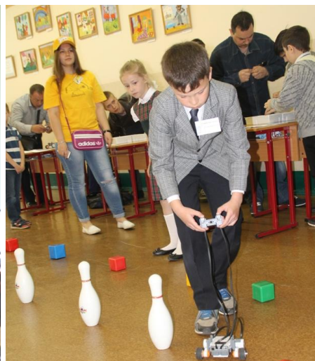
В одном из конкурсов нужно было собрать робота и продемонстрировать его работу.