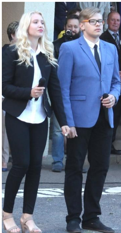
Выпускной класс – на финишной прямой.

После теплого и солнечного лета отдохнувшие ребята идут в первый день осени на учебу. Для кого-то – это праздник, а для кого-то – это траур. Множество ребятшек идут только первый раз в школу. Видно, как волнуются первоклассники и их родители. Отпуская своих любимых детей впервые в школу, у многих родителей на глазах слезы. Почему они плачут? Возможно, они понимают, что их ребенок растет, а кажется, не так давно они сами стояли с букетом цветов и радостно встречали первого учителя.