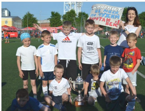
Наш «первоклассный» «Динамо» стал лучшей командой в регионе.