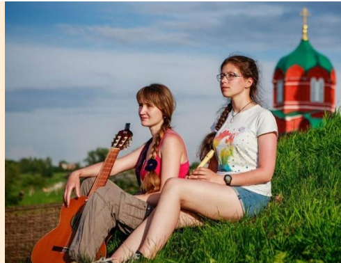
На Фестивале «Куликово поле»

На Фестивале авторской песни и поэзии Межрегионального значения «Созвучие», который состоялся в Большом Селе 17-19 июня, ансамбль «Три-звучие» удостоен звания Дипломанта. Впечатлениями об этом замечательном фестивале поделилась наш корреспондент.