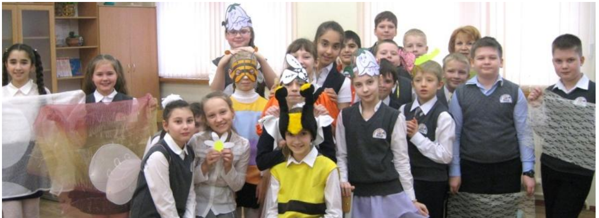
Четвероклассники поставили спектакль «Пчелка-именинница».

Ученики пятых классов приняли участие в игре «Мы - пчелки 90-й», шестые - в интерактивной игре «По страницам школьных предметов», седьмые - в викторине «Собери мед». «Каждый класс разделили на четыре группы, получилось четыре сборные