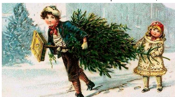
С Новым годом и Рождеством Христовым!

Трудно поверить, но история ёлки в России насчитывает всего-то около полутора сотен лет.