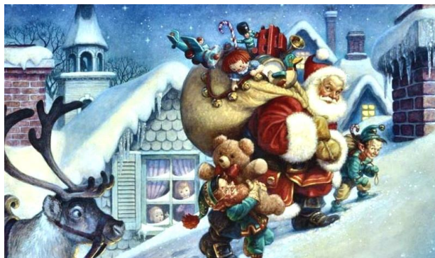
Санта Клаус проносит свои подарки в дом через печную трубу.