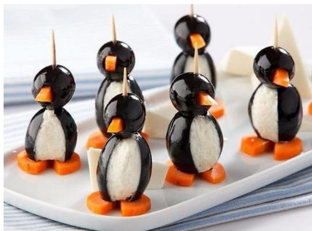
Стая нарядных «пингвинчиков» на столе будет создавать праздничное настроение.

Таких «пингвинчиков» можно сделать несколько.