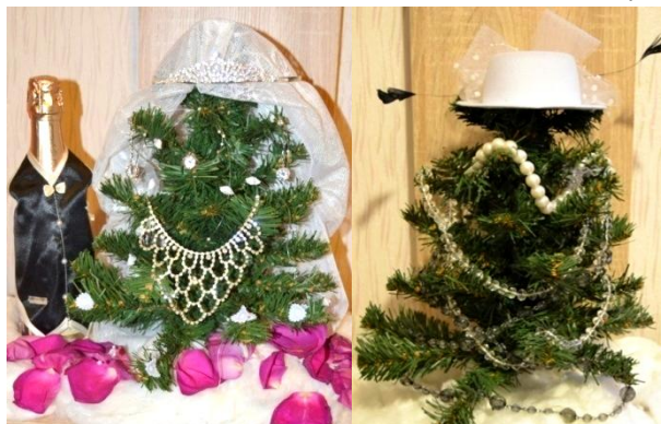
Мамины бусы станут необычным украшением лесной красавицы.