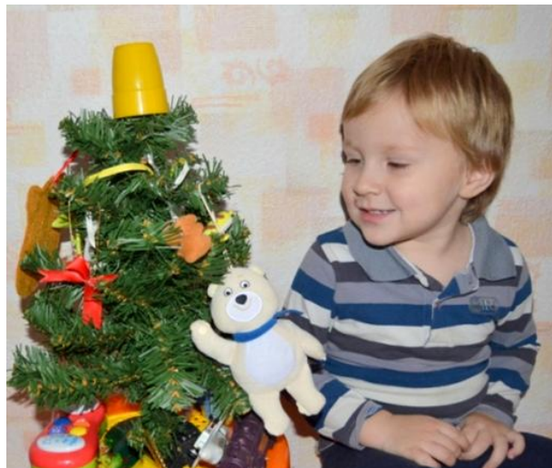
Украшать елочку своими любимыми игрушками понравится любому малышу.

Праздник волшебства и исполнения желаний уже на пороге. А главное украшение праздника – «лесная красавица», она тоже может быть креативной и привлекательной.