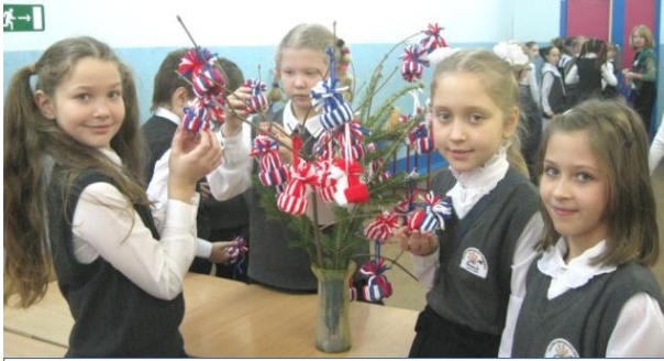
Мастерская кружка «Мягкая игрушка».