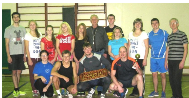
В соревнованиях по волейболу сильнее оказалась команда педагогов.

Необычный праздничный вечер запомнится надолго яркой игрой команд, веселыми шутками, теплой атмосферой. Коллектив школы еще раз показал, что школа № 90 – это большая дружная семья!