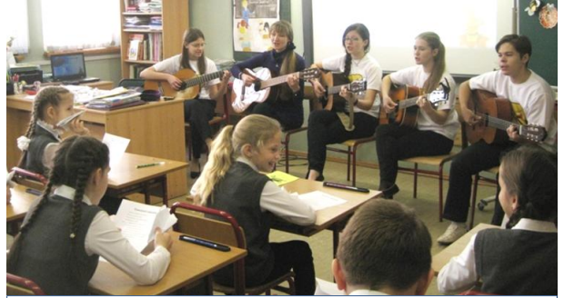
Студия «Три-звучие» исполняет песню «Самолетик».

15 декабря наша школа отметила 17-й день рождения. Школа была ярко украшена, всех встречали любимые «живые» пчелки, создавая и детям, и взрослым прекрасное настроение. В фойе собрался целый рой пчелок на выставке «Пчелка-именинница» ( Подробнее - на стр. 4 ). Свои экспозиции на тему «Праздничная мозаика» подготовили изостудия «Пчелка» и кружок «Мягкая игрушка». Стены школы украсили лучшие работы фотоконкурса «Школьный мир глазами детей». Участники проекта «На желтых крыльях мечты» познакомили со своими сочинениями и эссе на тему «Какой будет школа в свой 20-й год рождения». Первоклассники помечтали на тему «Я в будущем», представив свои фотографии и рисунки. На конкурс «С праздником, дорогая школа!» ученики представили литературное и компьютерное творчество.