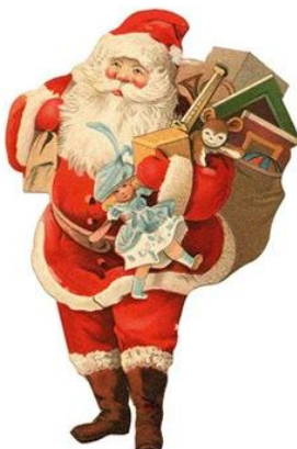
Дед Мороз и Санта несут подарки в мешках.

Дед Мороз появился на Руси до принятия христианства и представлял собой духа предков, который заботился о приплоде скота и хорошей погоде. По другой версии, «прапрадедом» Деда Мороза был герой русских народных сказок Морозко. Если Дед Мороз, скорее, языческий дух или персонаж сказок, то прототипом Санта Клауса является реальная историческая личность – святой Николай, который жил в IV веке. Он был очень добрым и щедрым человеком, тайно делал подарки бедным людям, у которых есть дети. Однажды (поскольку все окна в доме были заперты) Николай бросил подарки в печную трубу. Скатившись по трубе, они случайно попали в носки, которые повесили хозяева, чтобы высушить.