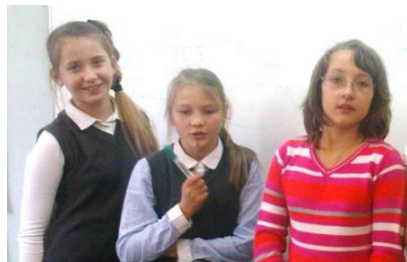
«Звездочки» школьного Пресс-центра.

В середине сентября в школе начал работать Пресс-центр, и вот уже готов первый номер школьной газеты «СОТЫ»! Юные корреспонденты проявили инициативу, большой интерес, преодолели трудности и подготовили для вас самые разные материалы. Это и новости, и интервью, и эссе.