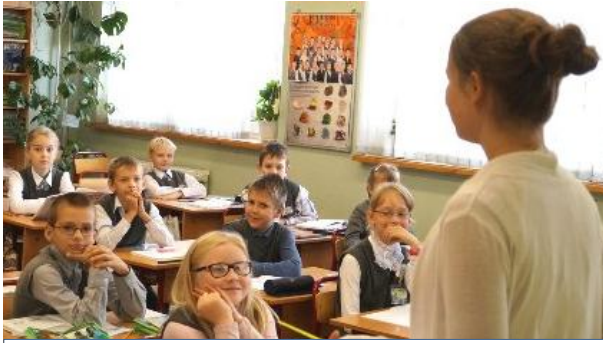
Рита была бы самой доброй и красивой учительницей.

Если бы мне представилась возможность быть учителем, я бы стала учителем младших классов. Я бы относилась сострадательно к своим ученикам, искренне их любила, ведь не зря учительницу называют «второй мамой». Но самое главное – я бы постаралась помочь им раскрыть свои таланты, понять самих себя.