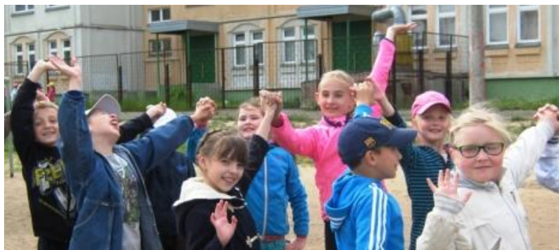
Каждый в школьном лагере проходил активно и весело.

Много впечатлений у детей оставило посещение библиотеки при ДК «Слепых», где прошли уроки толерантности. Ребята еще раз поняли, как важно уважать и принимать любого человека.