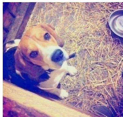
Теперь у Лиги есть добрая хозяйка.