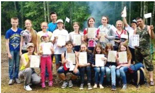
«Три-Звучие» всегда имеет успех на конкурсных площадках.

В памяти надолго останутся и бессонные звёздные ночи с песнями у фестивальных костров, и борьба с волнением и страхом перед выступлениями, и счастливые моменты награждения.