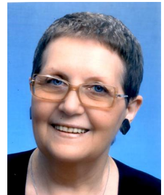
Наталия Юрьевна всю жизнь посвятила детям.