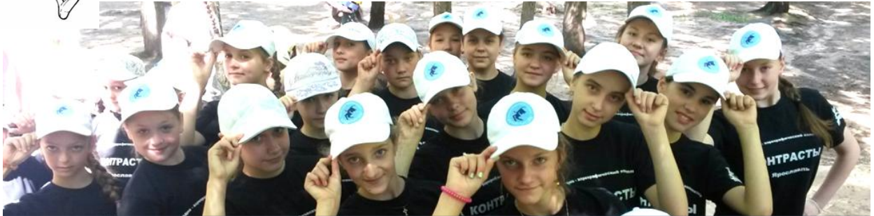
. Дружная и красивая компания девочек из коллектива «Контрасты» была самой крутой в лагере.

Уже три год подряд участники Эстрадно-хореографического коллектива «Контрасты» отдыхали в детском оздоровительном лагере «Молодая Гвардия».