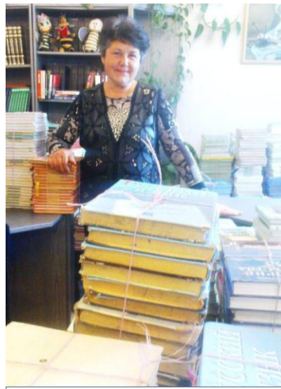
В библиотеке – горы учебников.