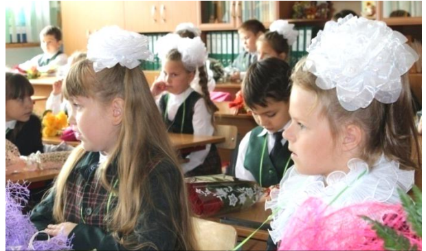
Ученики 1 «В» класса на своем первом школьном уроке.

В этом году в школе открылось шесть первых классов. Чтобы всем хватило места, летом в школе был произведен ремонт.