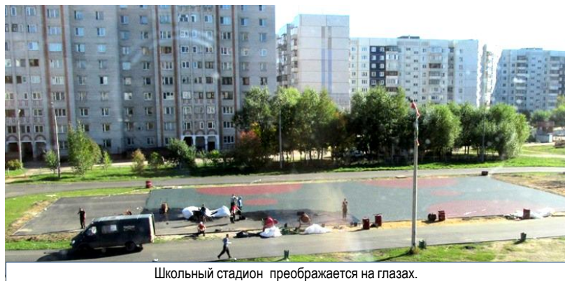
Школьный стадион преобразается на глазах.

В самом начале учебного года на школьного стадионе началось какое-то движение.: грузовые машины, какие-то люди с оборудованием и стройматериалами. Чем помешало строителям наше футбольное поле?