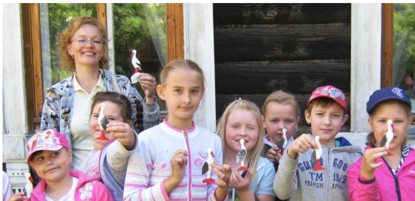
В музее Богдановича ребята расписали аистов.

В лагере нам было интересно. Время проводили мы полезно. Нового так много мы узнали! Ведь не только в игры мы играли.